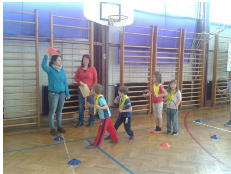
Gibalna igra Semafor