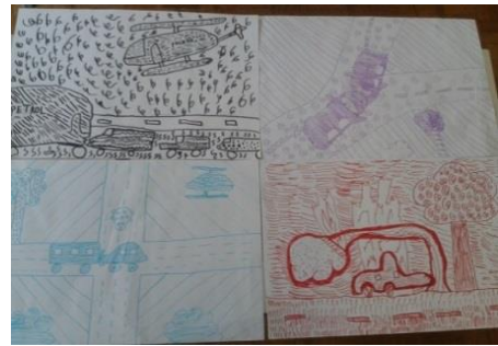
Črna risba - Nesreča