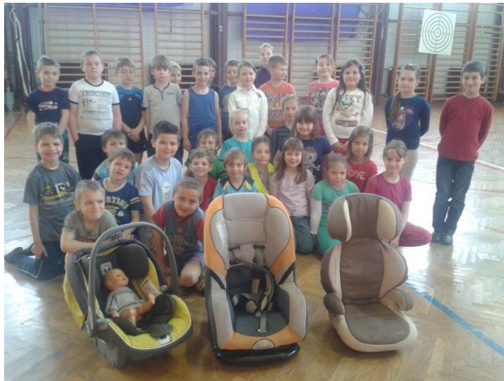
Različni otroški sedeži