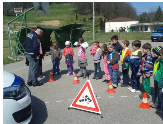
Policisti se predstavijo...