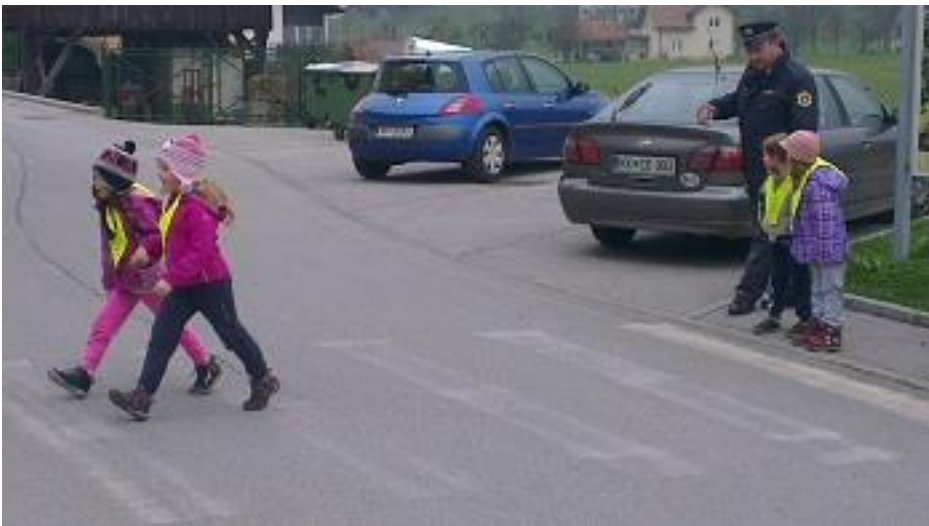
Pravilno prečkanje ceste