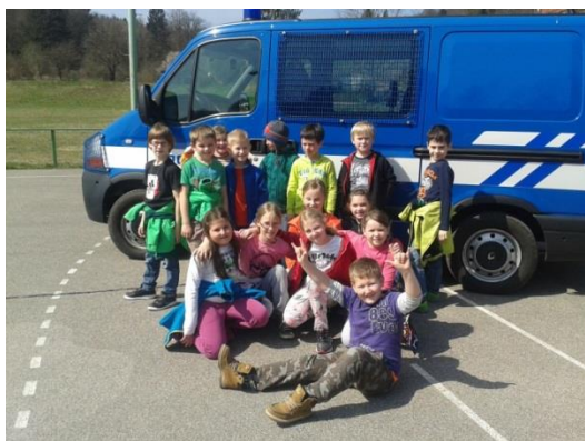
Pred policijskim kombijem