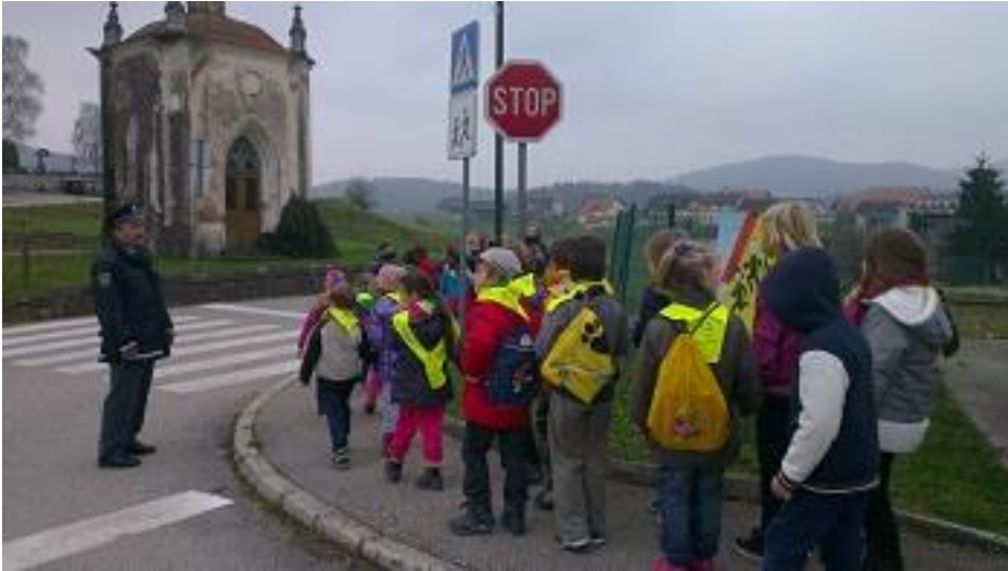
Sprehod po naselju s policistom

pešce, hojo po pločniku in hojo po cesti, ki nima pločnika. Policist nam je razložil tudi prometne znake, ki so ob cesti.