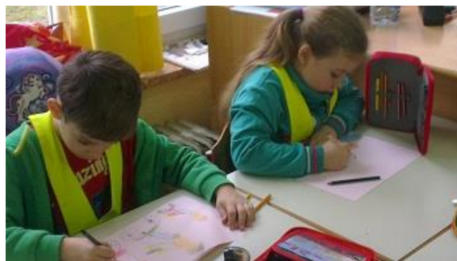
Izmišljanje svoje zgodbice