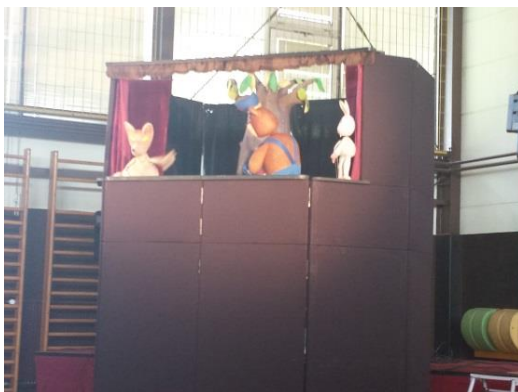
Lutkovna predstava 113