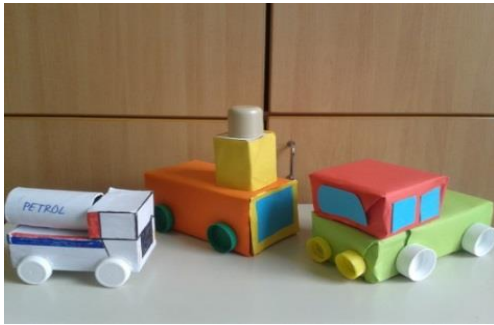
Vozila iz odpadne embalaže