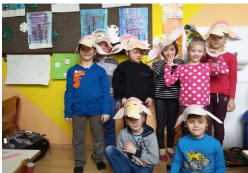
Izdelovanje pustne maske Pasavček